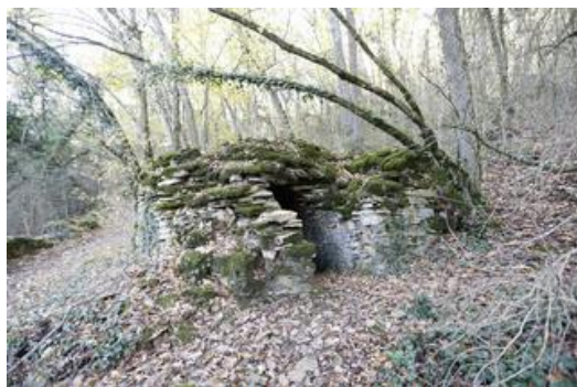
Une des Cabornes à restaurer

A titre d'exemple une vidéo du dernier chantier en cours d'achèvement à St Didier : cabane des dalles , d'autres exemples sur le site de Saint Cyr au Mont d'Or « les cabornes »