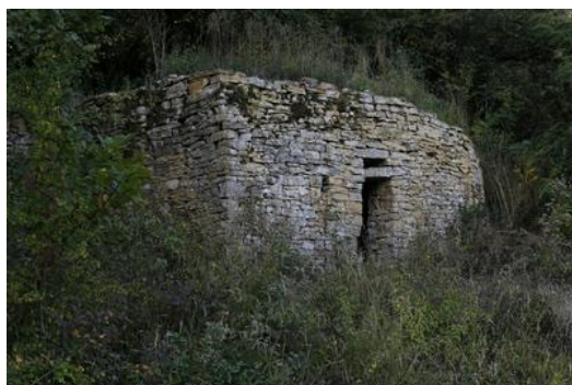
La fameuse caborne double

Venez nous rejoindre. Ces chantiers se déroulent les mardis de 14h à 18h dans la bonne humeur. Ainsi dès le mardi 30 avril à 14 h, ce chantier se poursuivra avec toutes les bonnes volontés, chemin du Chêne.