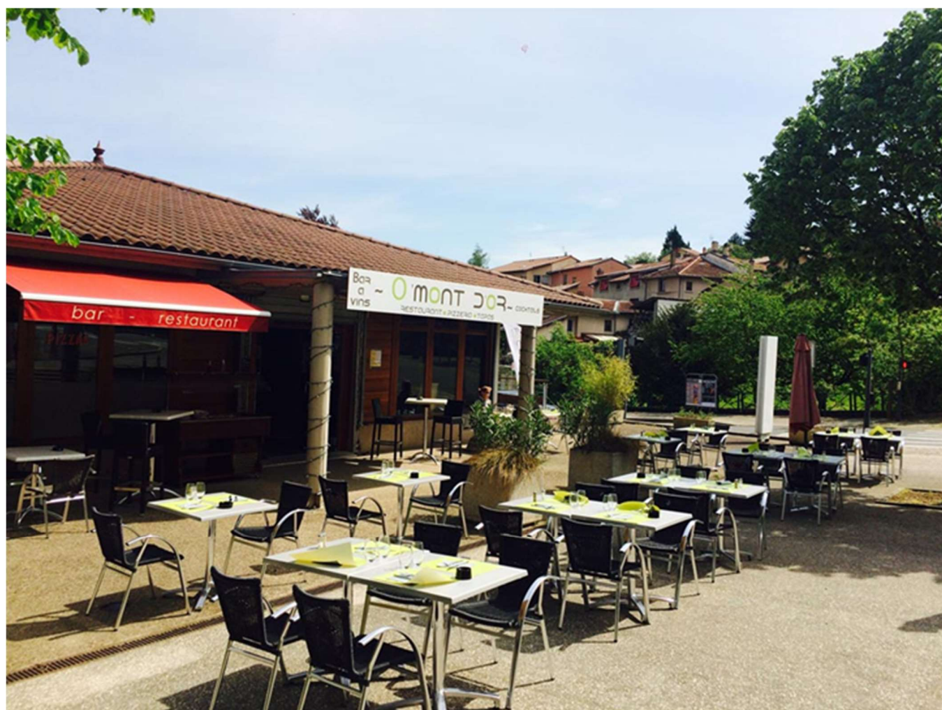
Photo du local depuis l'extérieur