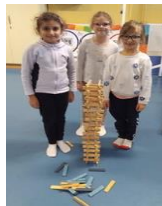
Parents et enfants en activité: tir à l'arc et jeux de construction