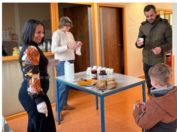
Accueil du soir convivial autour du stand de crêpes